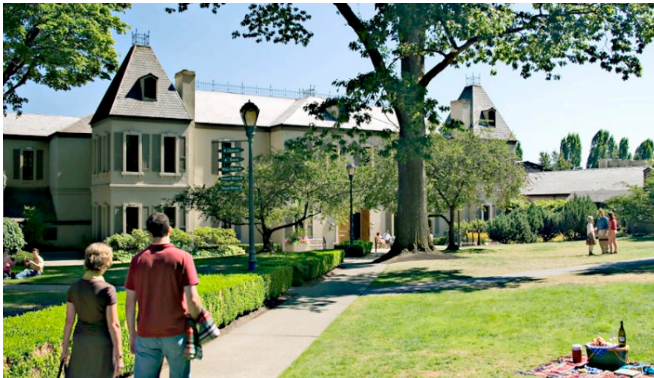
Chateaux Ste Michelle.